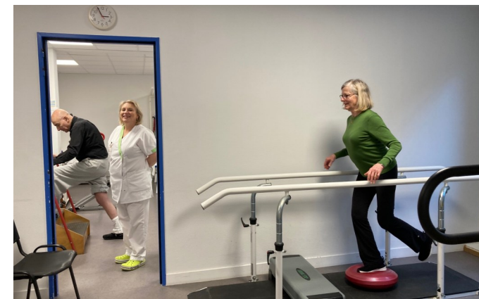
Espace de Kinésithérapie