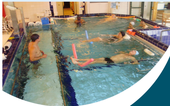
Espace de Balnéothérapie

Vous serez accueilli(e) par la secrétaire avant la consultation médicale.