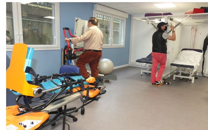
Espace de Kinésithérapie